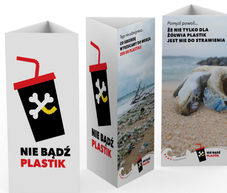
Stand na stolik