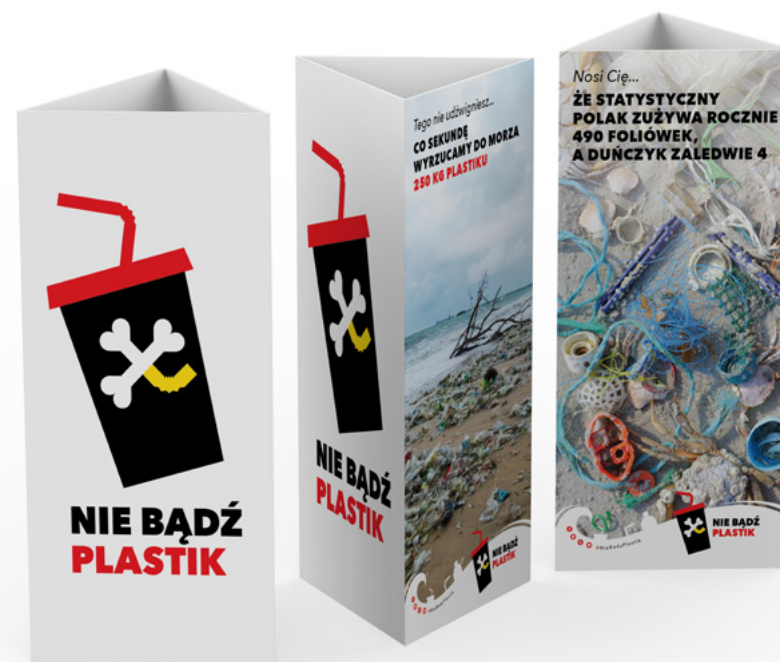
Stand na stolik