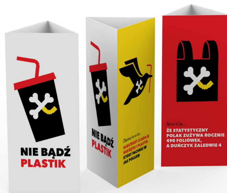
Stand na stolik